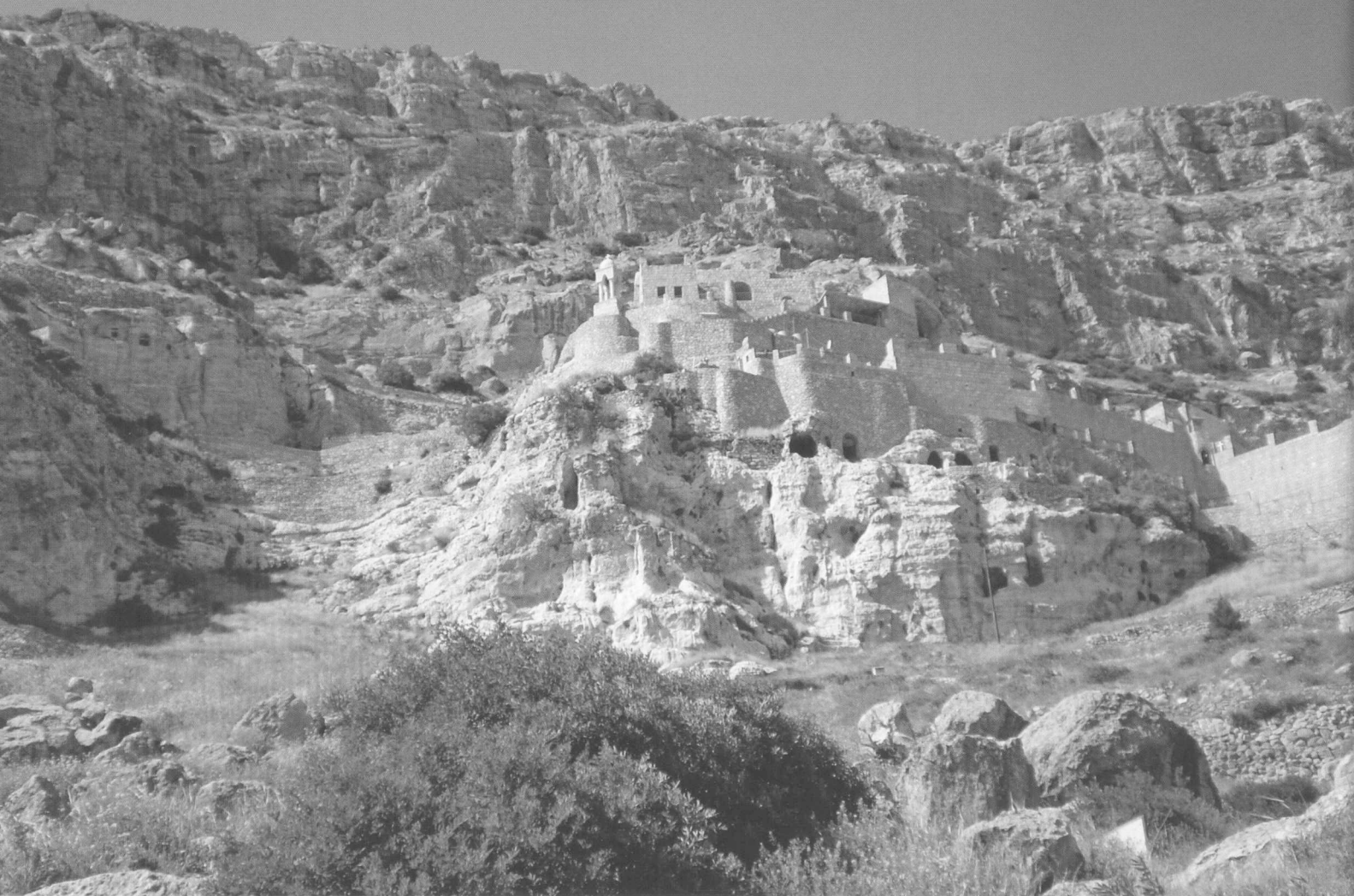
Das Kloster Rabban Hormizd bei Alqosh (Nordirak) – gegründet im 7. Jh., heute nicht mehr besiedelt.

stropfen der ostasiatischen und nahöstlichen Geschichte haben im 13./14. Jh. zu einem raschen Niedergang geführt. Im Nordirak und seinen benachbarten Landstrichen lebten, wie Bünting richtig bemerkt, die zahlenmäßig bescheidenen Gemeinden fort. Vom Wüten des „Islamischen Staates“ wurden sie in jüngster Zeit an den Rand des Untergangs gebracht. In Mossul lebt heute kein Christ mehr.