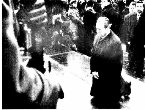
Bundeskanzler Willy Brandt am 7. Dezember 1970 vor dem Denkmal für die Aufständischen des Warschauer Ghettos

die einzelnen Verbrechen schon bekannt oder wurden durch gemeinsame Kommissionen, Forschungsgruppen und Vergangenheitsaufklärungsverfahren ans Licht und an die Öffentlichkeit gebracht. Aber durch den ausdrücklichen Akt der Anerkennung bekennt sich ein Staat zu seiner Geschichte und übernimmt Verantwortung nicht nur für das wertvolle Erbe der Vorfahren, sondern auch für die Auswirkungen des Misslungenen in Vergangenheit und Gegenwart. Für den Akt der Anerkennung ist es wesentlich, dass er in der Öffentlichkeit stattfindet, so also dass alle oder jeder, der es wissen will, sich als Glied dieses Kollektivs wahrnimmt, ohne deshalb zum individuell schuldigen Verantwortungsträger gemacht zu werden. Nur im kleinen Kreis oder auf die Ebene der diplomatischen Beziehungen beschränkt, käme gerade diese Repräsentanz für die Gesamtheit der Bevölkerung nicht zustande. Auch ist wichtig, dass der Akt der Anerkennung historischer Schuld in Szene gesetzt und durch Feierlichkeit, Aufmerksamkeit stiftende Symbole und Rhetorik unterstrichen wird.