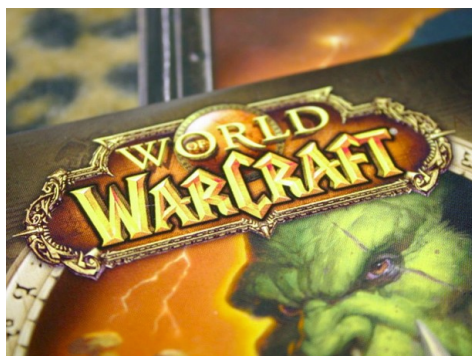
1994 brachte das Entwickler-Studio Blizzard Entertainment das Spiel Warcraft auf den Markt. Während dieses und seine ersten Fortsetzungen Echtzeitstrategiespiele waren, ist World of Warcraft von 2004 ein Massively Multiplayer Online Role-Playing Game (MMORPG).

Abseits von narrativen und ästhetischen Verarbeitungen finden sich aber auch Tendenzen unter den Spieler_innen selbst, ihre eigene religiöse Identität, Lebenswelt und/oder Sozialisation in die Spiele hineinzutragen. Dies äußert sich beispielsweise in „Ingame“-Gedenkfeiern für verstorbene Mitspieler_innen in Online-Rollenspielen wie EVE Online oder World of Warcraft . Hier werden häufig den Spielern bekannte Praktiken von „außen“ in die Spielwelt transportiert und dort mit den (meist begrenzten) Mitteln der Spielmechaniken umgesetzt und dabei nicht selten transformiert. So wurden etwa 2012 in EVE Online im Gedenken an einen ums Leben gekommenen Mitspieler aus „ Cynosural Field Generators “ (einem Ingame-Ausrüstungsgegenstand mit primär militärischer Funktion) Trauerkerzen. Ein Ritual, welches sich erst kürzlich in Gedenken an einen weiteren verstorbenen EVE Online -Spieler wiederholt hat.