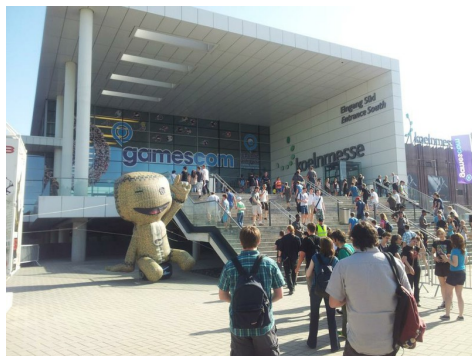
Besucher_innen bei der Gamescom 2012 in Köln.

Anhand dieser und weitere Beispiele lässt sich also durchaus ein „Eigenleben“ religiöser Elemente in Spielen auch außerhalb der Spiele feststellen, wobei auch hier die Forschung erst am Anfang steht und vor allem der Bedarf an weiteren empirischen Daten deutlich spürbar wird. Spannend sind hier Fragen der Wechselwirkung zwischen der religiösen Identität der Spieler_innen und den von ihnen gespielten Spielen sowie die Frage nach der Rolle der Spieler-Agency, welche ja ein zentrales Merkmal von Computerspielen darstellt.