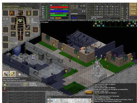
Das Dorf von Stoneglow aus dem Open-Source-Spiel Daimonin (Version Beta 3 von 2004). Zur Vergrößerung klicken Sie auf den Screenshot.

Dieselbe Offenheit galt auch für die Spiele, welche behandelt wurden bzw. behandelt werden durften. Auch hier schränkten wir die Autoren nicht ein und so wäre prinzipiell die Auseinandersetzung mit jeder Art von digitalem Spiel möglich gewesen, inklusive etwa so genannten „Serious Games“ oder experimentellen Spielen. In der Praxis entschieden sich jedoch die meisten Autoren (uns eingeschlossen) verständlicherweise für gut bekannte und/oder meist kommerziell erfolgreiche Spiele wie BioShock: Infinite , Mass Effect , Dragon Age 2 , Journey oder EVE Online , da deren Popularität und Massenwirkung oft leichter greifbar ist als die von kleineren und unbekannteren bzw. weniger erfolgreichen Titeln.