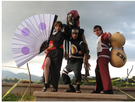
Drei Cosplayer_innen in Guatemala 2008.

Identitäten bzw. „Realität(en)“ sein kann.