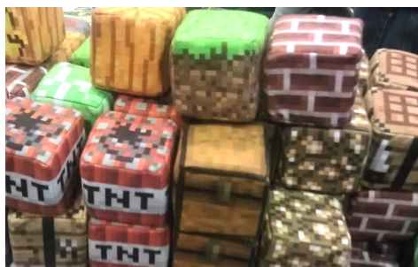
Dem Spiel Minecraft nachempfundene Spielzeugwürfel auf der Multigenre Fan Convention Pyrkon in Polen 2013.

Bild von Klapi unter Creative Commons Lizenz CC BY-SA 3.0 .