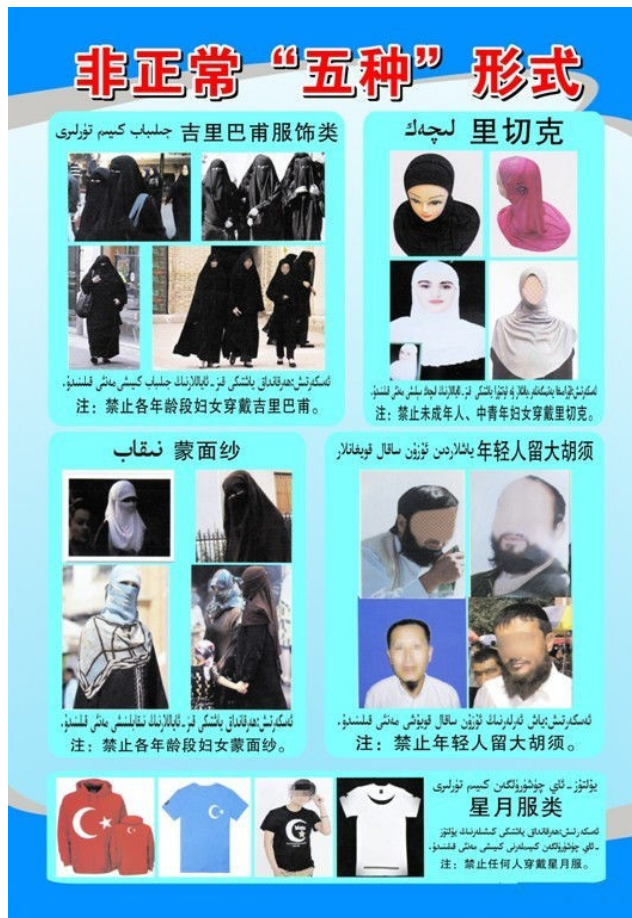
Dieses diskriminierende Hinweisschild in Bussen schließt für Menschen mit Verschleierung oder bestimmten Bärten die Nutzung aus (Xinjiang, 2014).

Dieses „Unvermögen“, sich an die chinesischen Gesellschaftsideale anzupassen, lässt den Konflikt mit China als Nabel der Welt, welches die ungebildeten „Barbaren“ belehren möchte, wieder aufleben. Die Weigerung, die Ideale Chinas für sich anzunehmen, führt dazu, dass die Uiguren von der Regierung abgestraft und von den Han-Chinesen abschätzig betrachtet werden. Allein die Weigerung, Mandarin zu lernen, heißt für Han-Chinesen nichts anderes, als dass Uiguren „dumm“ oder kulturell minderbemittelt seien. Dabei pflegen natürlich beide Seiten Vorurteile gegeneinander.