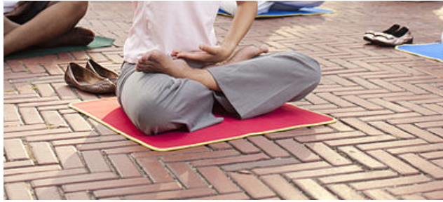
Falun-Gong-Praktizierende meditieren in einem Park in Manhattan, New York.