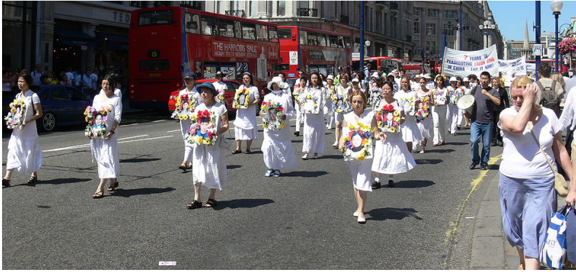
Eine Prozession von Falun-Gong-Anhängern in London in der Nähe der chinesischen Botschaft. Die Demonstranten halten Porträts von Verfolgten und Hingerichteten.