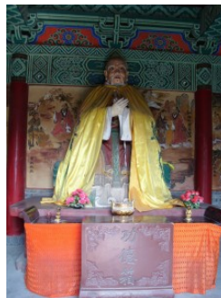
Im Vergleich dazu die wohldekorierte Halle des Konfuzius. Die biographischen Malereien an den Wänden basieren auf den buddhistischen Jataka-Malereien. Diese wurden erstmals in Qufu für Konfuzius übernommen.