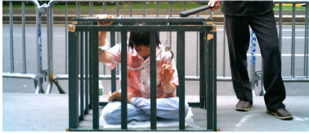
Falun-Gong-Demonstration in New York 2004 gegen Folter.