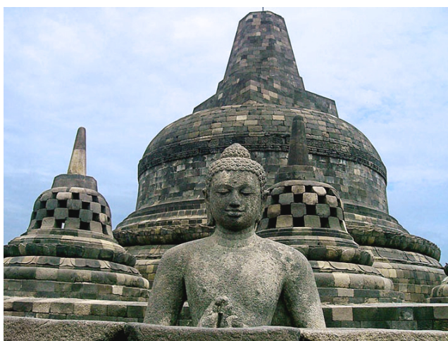
Die bedeutendste Stupa-Architektur auf der Welt ist auf dem indonesischen Java der Borobudur-Komplex (Baubeginn 8. Jh.).