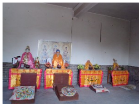
Das ist die heutige buddhistische Halle des Longmafutu-Tempels, die alle Schreine, die sonst in einem Tempel in mehreren Räumen stehen, versammelt. Liebles, ohne Dekoration – das hält die Anhänger aber nicht ab. Klicken Sie zur Vergrößerung jeweils auf die Fotografien.

So kann man sich diesen Transformationsprozess vorstellen. Die Wurzel-Metaphorik ist auch heute noch für die Kommunistische Partei Chinas (KPC) sehr wichtig, daher wird der Tempel heute als neo-konfuzianisch inszeniert. Überall hängen Yin-Yang-Symbole, aber die nackten Darstellungen von mythologischen Wesen (wie der Frau von Fu Xi, Nü Wa) wurden rot überstrichen. Der Tempel wurde komplett neu aufgebaut, doch man wusste, dass dort einst buddhistische Entitäten verehrt wurden, und es gibt lokale Legenden, nach denen Umbauten mit Blitzeinschlägen bestraft worden seien. Deshalb beinhalten die großen Hallen Statuen von Fu Xi, Konfuzius und den Drei Kaisern der Vorzeit, aber es gibt auch eine Halle für Muttergottheiten und eine Halle, die das komplette Ensemble eines buddhistischen Tempels beinhaltet. In den letzten beiden Hallen habe ich Spuren von Verehrungspraxis gefunden, in den großen nur bei den von Anwohnern selbst aufgestellten Glücksgöttern. So etwas nenne ich eine „dekorative Situation“ – die offizielle Religion eines sakralen Ortes entspricht nicht der ausgeübten Religion. Diese Dekoration ist das Merkmal eines in China üblichen Prozesses der Trennung zwischen Schrift- und Praxiskultur. Die Schriftkultur beschreibt eine ideale Realität, die an der Wirklichkeit oft vorbeigeht, aber die politische Leitung zufrieden stellt.