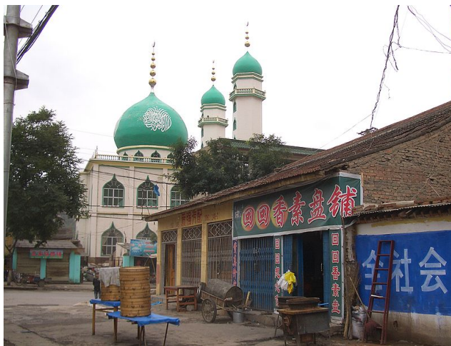
Machang-Moschee in Linxia in der chinesischen Provinz Gansu.