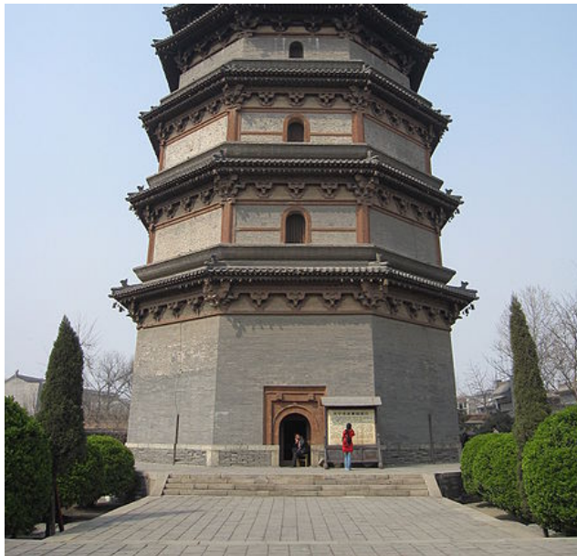
Als Beispiel für eine Pagode sei die Lingxiao-Pagode von Zhengding, Hebei-Provinz, China, abgebildet.