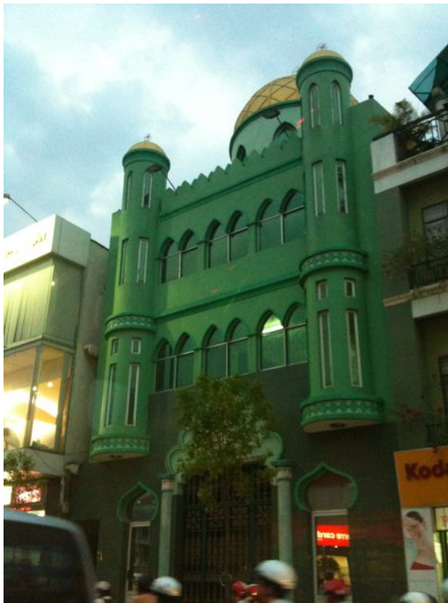
Jamiul-Moschee in Ho Chi Minh City, Vietnam.

Sozialneid bestimmt nicht nur die aktuelle Flüchtlingsdebatte, er ist von jeher und überall auf der Welt ein Faktor für den Umgang mit den Fremden – auch der chinesische Umgang mit den Hui zeigt das.