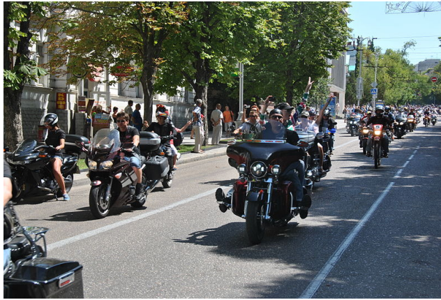
Ausfahrt eines (beliebigen) russischen Motorradclubs (2012). In Abgrenzung von der überwiegenden friedlichen Masse der Mitglieder von Motorradclubs nennen sich sogenannte Outlaw-Biker seither auch Onepercenter in Anspielung darauf, dass ihr Anteil an Motorradfahrern insgesamt nur 1 Prozent betragen soll (Wikipedia-Paraphrase von: Christian Ertl: Macht's den Krach leiser! Popkultur in München von 1945 bis heute, 2010, S. 30).