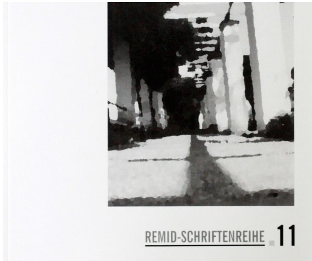
Buchcover der Kötter-Studie (2006), REMID-Schriftenreihe Nr. 11.

Rechtsradikalismus Religionsbegriff Religionsfreiheit Religionskritik Religionsphänomenologie Religionspsychologie Religionsstatistik Religionsunterricht Religion und Öffentlichkeit Salafismus Sektendebatte Spiritualität Säkularisierung Verschwörungsmythen Verschwörungstheorien Weltanschauung Zeugen Jehovas