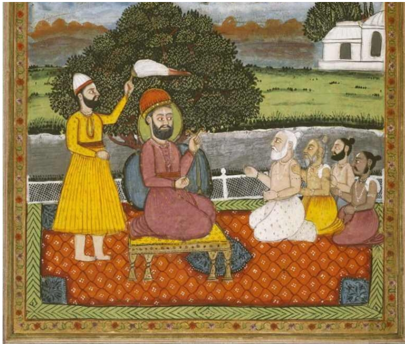
Guru Nanak trifft heilige Hindu-Männer (Bild entstand zwischen 1828 und 1830).

Die Konkurrenz und zeitweise Feindschaft zwischen Hindus und Muslimen – besonders in Nanaks Heimatregion Punjab – versuchte Nanak zu überbrücken und beide Religionen miteinander zu versöhnen. Aus seiner Sicht gab es keine Hindus oder Muslime, sondern nur Menschen, die auf der Suche nach Erlösung sind. Als Guru (Lehrer) lehnte Nanak eine institutionalisierte Gottesverehrung ab, äußere Rituale und Vorschriften würden einer tiefen, inneren Religiosität im Weg stehen. Seine zusätzliche Ablehnung von Praktiken, die auf Unterscheidung und Dualität beruhen (wie das verbreitete Kastenwesen in Indien), zog viele Schüler ( Sikhs ) an.