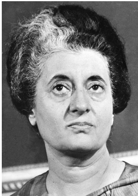
Indira Gandhi (1977).

Nach der Erstürmung des Tempels wurde der Punjab von der indischen Armee durchkämmt, um geflohene Terroristen aufzufinden. In den Augen vieler Sikhs war die Hauptverantwortliche Indira Gandhi, die ihren Erfolg über die Sikhs feierte. Am 31.10.1984 wandten sich ihre Sikh-Leibwächter gegen sie und ermordeten Gandhi.