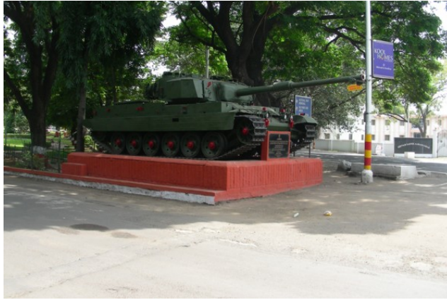
Auch Panzer kamen bei der Erstürmung des Tempels zum Einsatz. Die Abbildung zeigt einen Vijayanta Main Battle Tank der Indischen Armee (bzw. Vickers Mk 1 MBT). Das Monument gehört zum Außenbereich des National War Memorial (Maharashtra) in Pune (Indien).