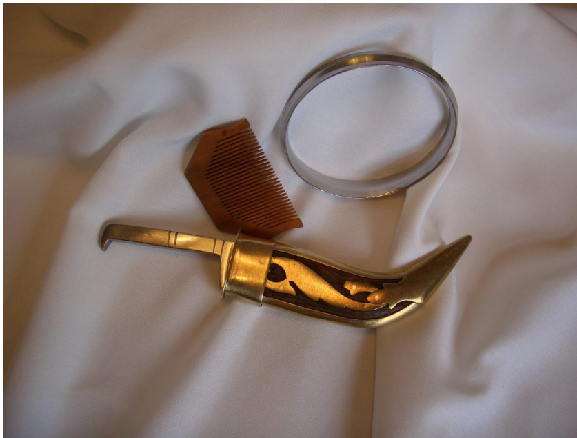
Drei der sogenannten fünf K's, Kamm, Armreif und Dolch.

Unter dem sechsten Guru Hargobind, dem Sohn des Märtyrers Arjun Dev, rüsteten sich Sikhs mit Waffen aus und prägten das Image der Sikhs als wehrhafte und stolze Gemeinschaft. Doch erst unter dem zehnten Guru Gobind Singh war die Transformation zu einem Kriegerbund abgeschlossen. Gobind Singh führte neue Riten und Eide ein, welche die männlichen Sikhs zum Khalsa, zu einer Bruderschaft der Reinen zusammenschweißte. Sikhs sollten fortan an den fünf K's erkennbar sein.