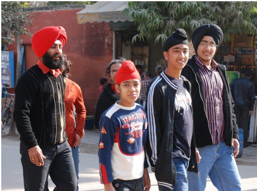
Sikh-Familie im indischen Agra. Die älteren Männer tragen den Turban, die jüngeren den sogenannten „Patka“.

Kaum jemand kennt den Sikh Verband Deutschland e.V. (gegründet 2013) oder das kürzlich neu eröffnete Deutsche Informationszentrum für Sikhreligion, Sikhgeschichte, Kultur und Wissenschaft . Vielleicht aber kennt man "die mit dem Turban" von einem indischen Restaurant. Oder das Kundalini Yoga der 3H Organisation Deutschland e.V. Aber man muss selbst auf der 3HO-Webseite Bezüge zum Sikhismus suchen: "Die Mantras im Kundalini Yoga stammen aus dem Gurmukhi, der Sprache des Sikh Dharma, so wie die Mantras im Hatha Yoga im Hinduismus wurzeln. [...] Eine Hinwendung zum Sikh Dharma ist nicht erforderlich". REMID hat bei religioholic.de – Faszinierendes und Spannendes aus der Welt der Religion(en) nachgefragt. Mit Erlaubnis der Autorin, der Religionswissenschaftlerin und Bloggerin Sabine Liesche, bringen wir einen Gastbeitrag über Sikhismus (im Original mit Teilen I und II).