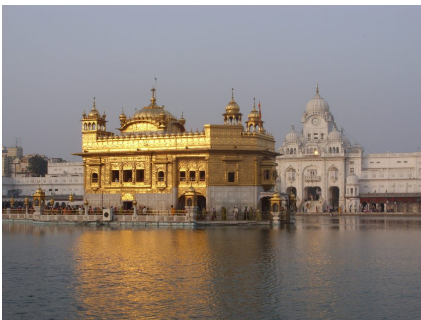
Der Goldene Tempel in Amritsar.

Bereits unter dem dritten Guru Amar Das wurde die Gemeinschaft zunehmend institutionalisiert: Pilgerzentren wurden eingerichtet, eigene Feiertage und Rituale eingeführt. Die Institutionalisierung war notwendig für die Festigung der Gemeinschaft, stand aber im Widerspruch zu den Lehren des ersten Gurus. Gerechtfertigt wurde dieser Schritt mit dem Guru Nanak selbst, der Guru Amar Das im Traum erschienen sei.