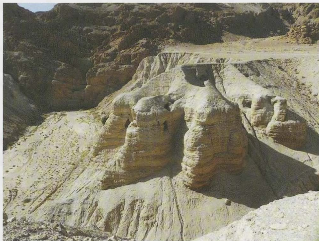
Höhlen bei Qumran; hier wurden u.a. Texte des apokryphen Buches Tobit gefunden.

der Problemstand bewusst. Doch statt konsequent die besten vorhandenen Textausgaben zu nutzen, nahmen sie nur sprachliche Retuschen vor. Das führte dazu, dass die Apokryphen der Lutherbibel kaum noch gelesen wurden und im wissenschaftlichen Gespräch gar nicht mehr zu nutzen waren.