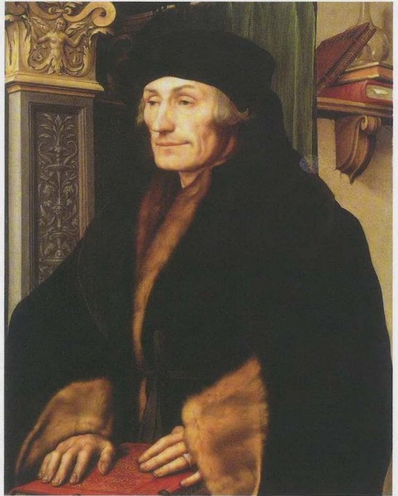
Hans Holbein d. J., Erasmus von Rotterdam (1523)

Martin Luther und Philipp Melanchthon (der als Humanist sogar seinen eigenen Namen »Schwartzzerdt« ins Griechische übersetzt hatte) nahmen diesen Ruf auf. So wurde es zu einer der grundlegendsten Maßnahmen der Reformatoren, die neue Bibelübersetzung auf die hebräischen und griechischen Textausgaben des Alten und Neuen Testaments und nicht mehr auf die lateinische Vulgata zu stützen. Das hätte nun Konsequenzen für die Anzahl und Anordnung der kanonischen biblischen Bücher haben müssen, denn wenn das Hebräische als Sprache des Alten Testaments zur Geltung kommen soll, hätten die Reformatoren eigentlich die apokryphen Bücher ausschließen müssen.