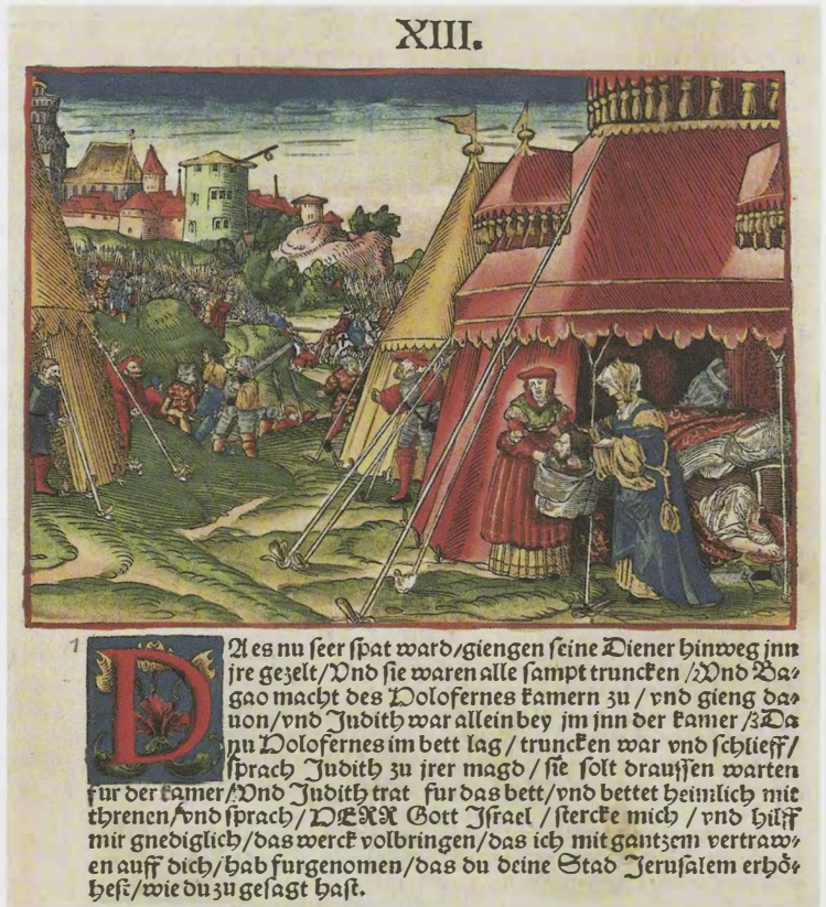
Lutherbibel 1534: Illustration zum Buch Judit: Judit und ihre Magd bringen das Haupt des Holofernes aus dem Lager der Feinde.

durch die die spätere Abwertung der Apokryphen im Protestantismus eingeleitet wurde. In den katholischen Bibelausgaben blieb es bei der bisherigen Anordnung der Bücher nach sachlich-inhaltlichen Gesichtspunkten. Hier werden diese Spätschriften des Alten Testaments auch nicht als »apokryph« bezeichnet. Stattdessen werden sie als »deuterokanonisch« eingeschätzt. Das lässt sich ebenfalls als