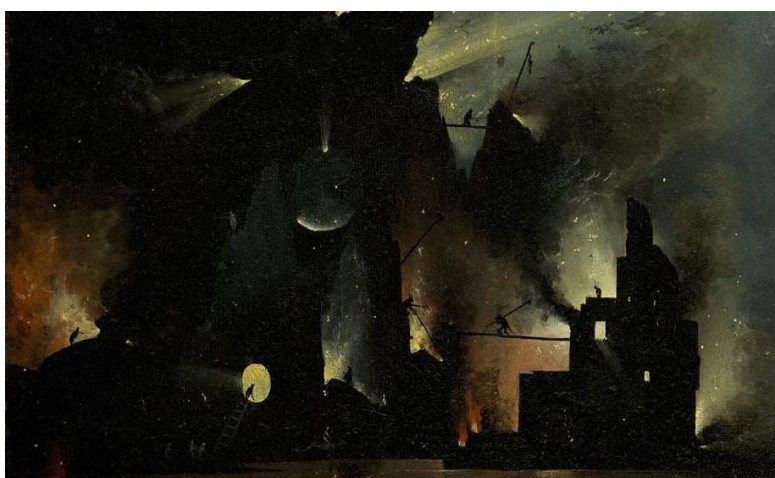
Recortes do tríptico O jardim das delicias de Hieronymus Bosch ([1505]2004).